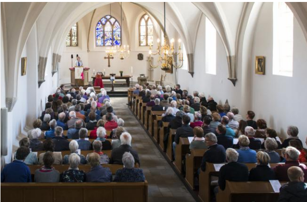
Een impressie van een geslaagde kerkendag: