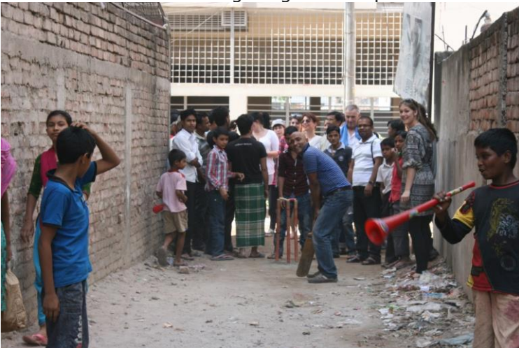
Cricket spelen met kinderen op straat in Dhaka